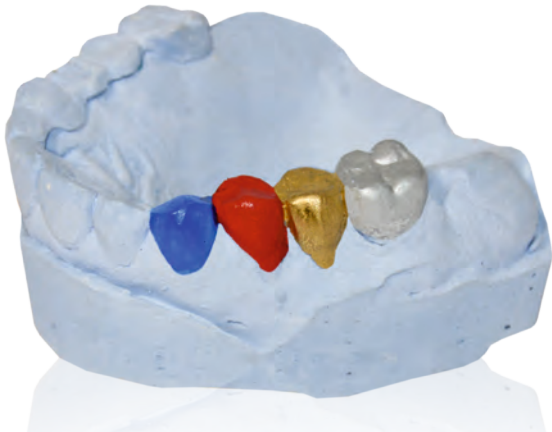
гипсовая модель с применением «ЗТ»-лаков различных цветов