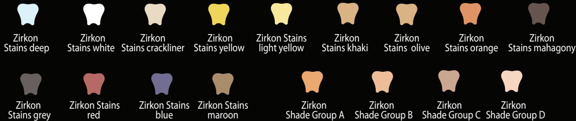
Таблица обжига масс Profi Zirkon